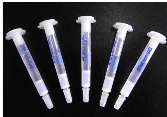
黄曲霉毒素免疫亲和柱