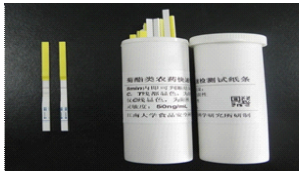
菊酯农药快速检测试纸条